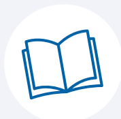
Libreria e biblioteche