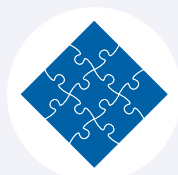
Integrazione studenti con disabilità e DSA