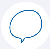
Servizio linguistico d'Ateneo