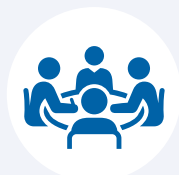
Orientamento e tutorato