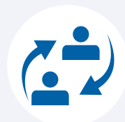
Stage e placement