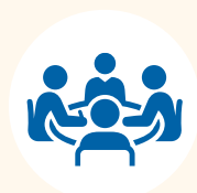
Orientamento e tutorato