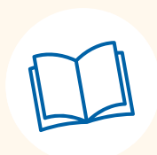
Libreria e biblioteche