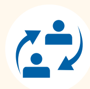
Stage e placement