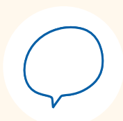
Servizio linguistico d'Ateneo